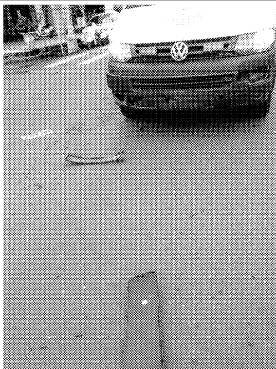
說明：車牌掉落及保險桿損壞