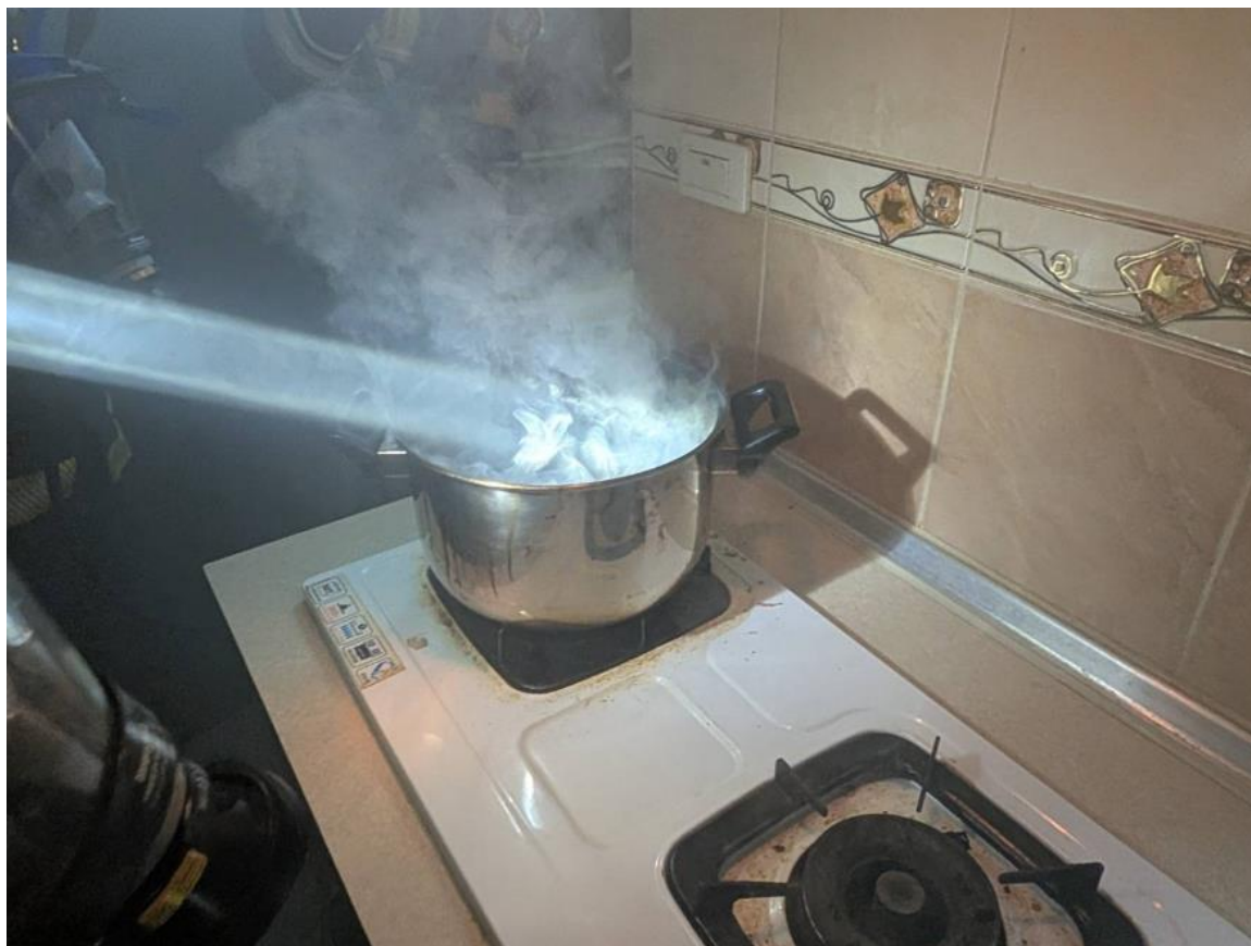
圖一：烹煮食物現場屋主關閉爐火滅火情形