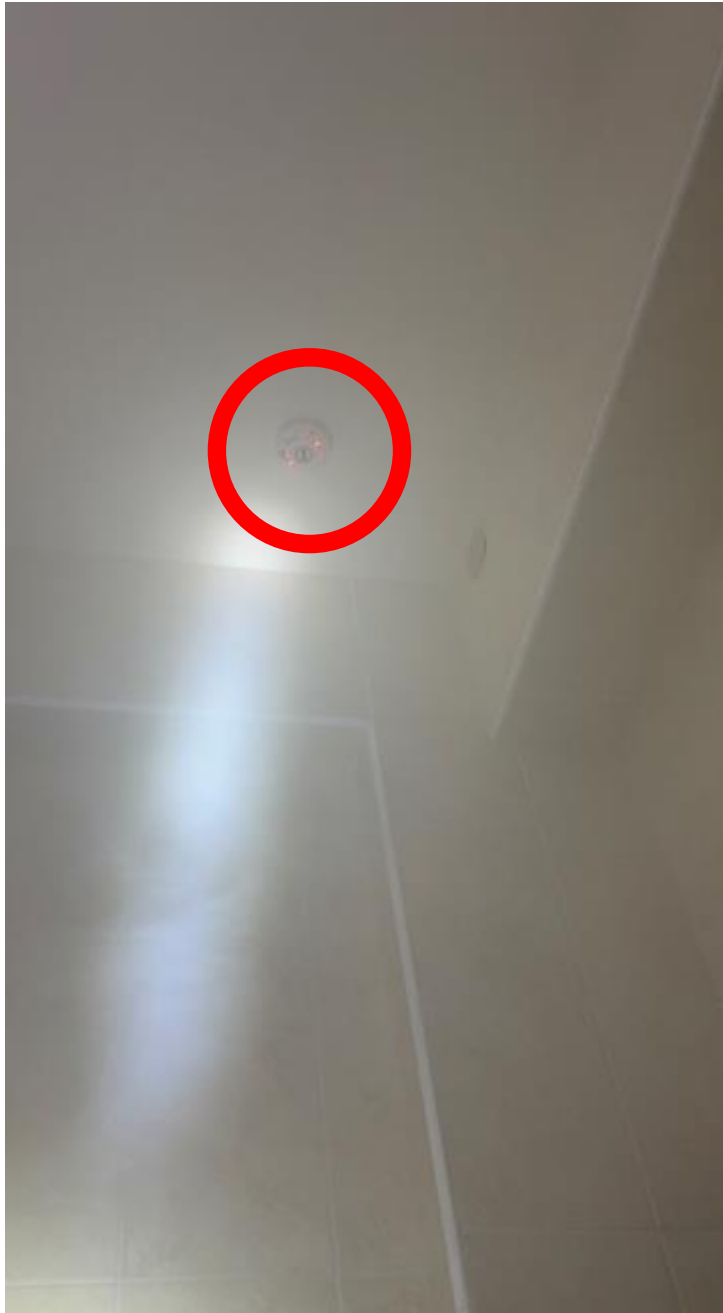
圖二：現場住警器鳴動情形。