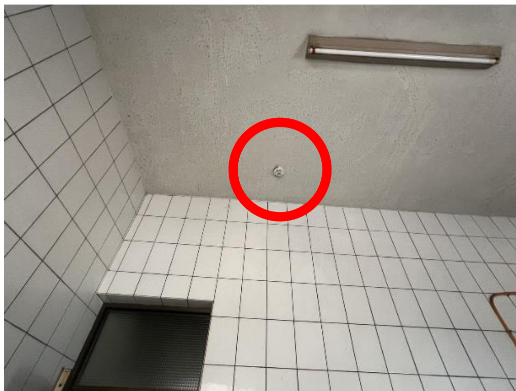
圖二：現場住警器鳴動情形。