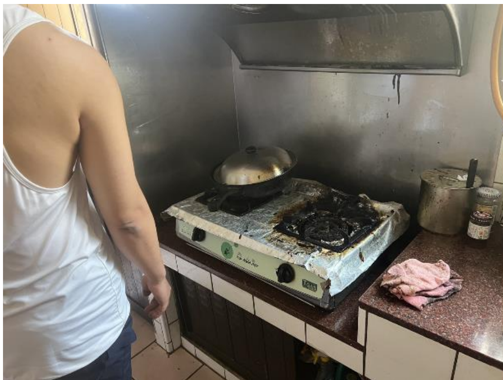
圖一：烹煮食物現場屋主關閉爐火滅火情形