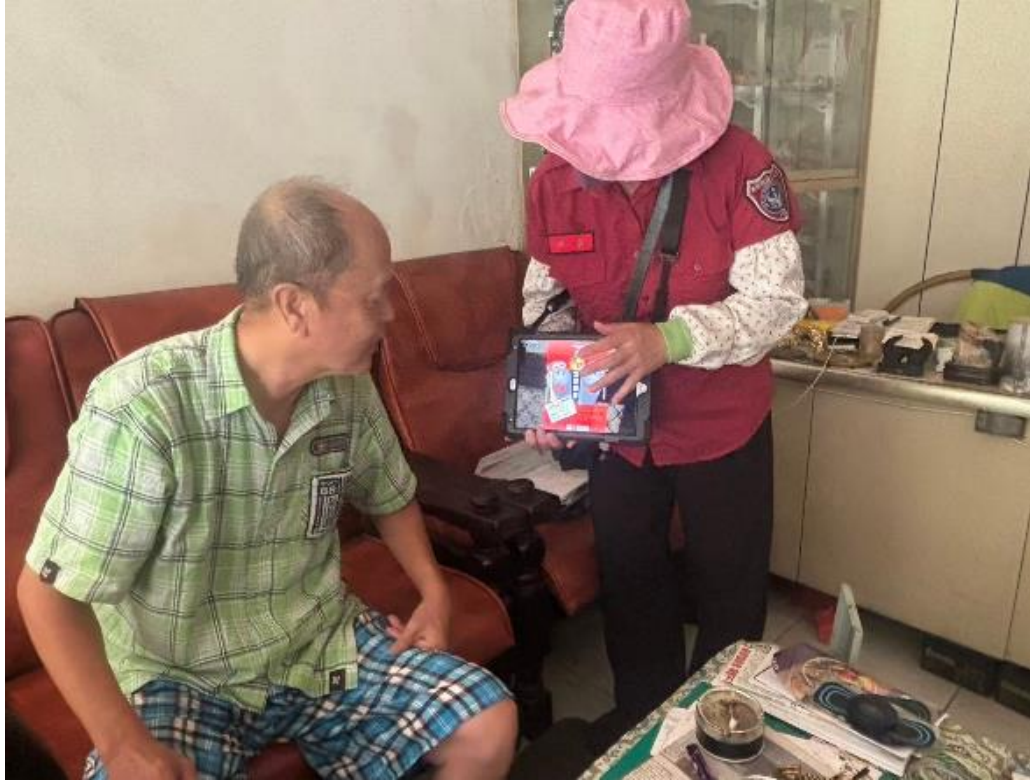
圖三：災後訪視宣導情形。