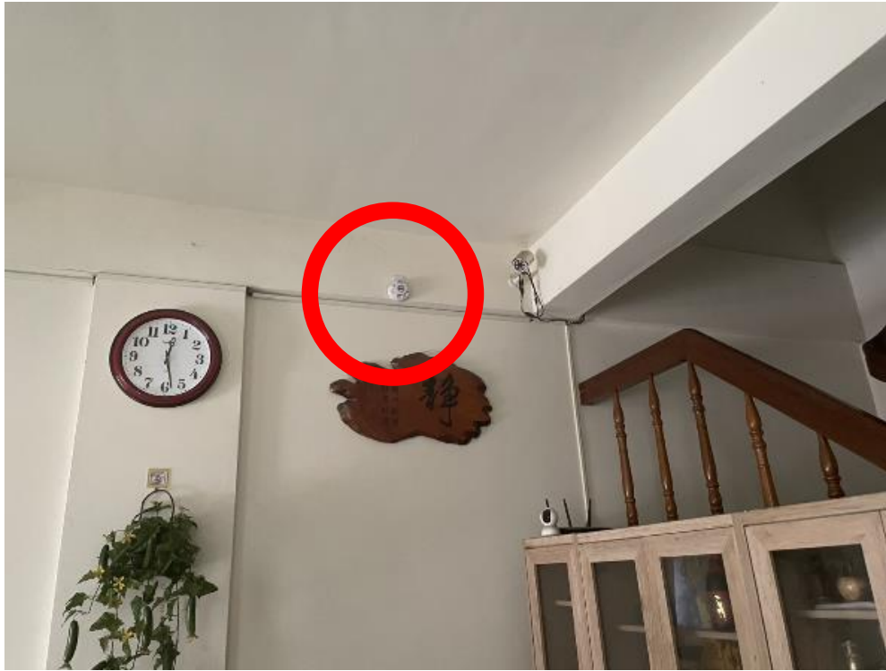
圖二：現場住警器鳴動情形。