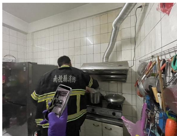
圖一：烹煮食物現場消防人員滅火情形