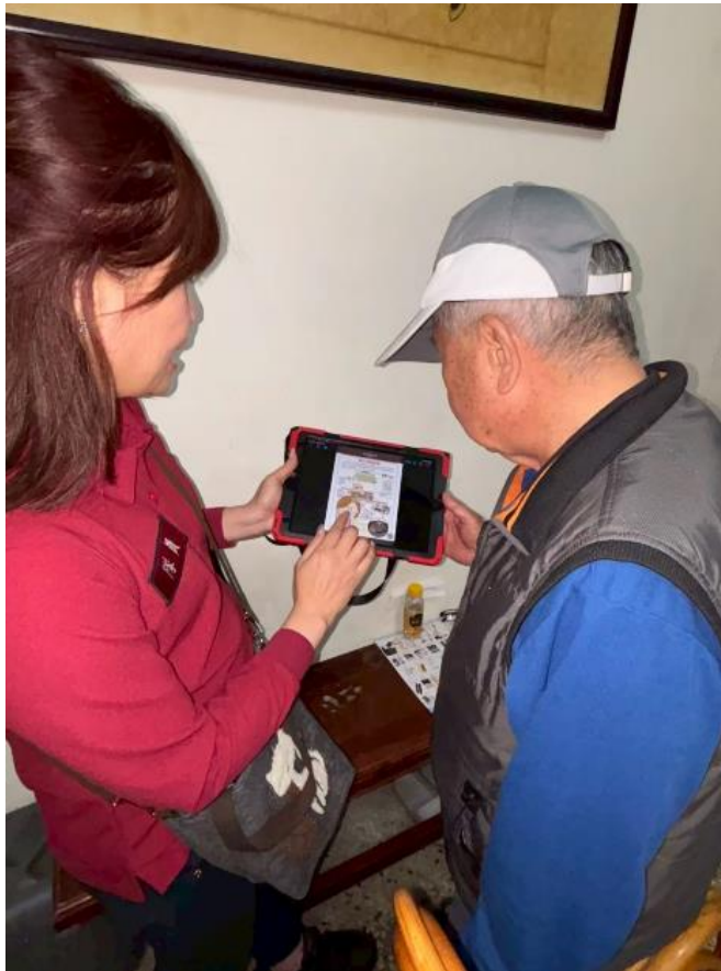
圖三：災後訪視宣導情形。