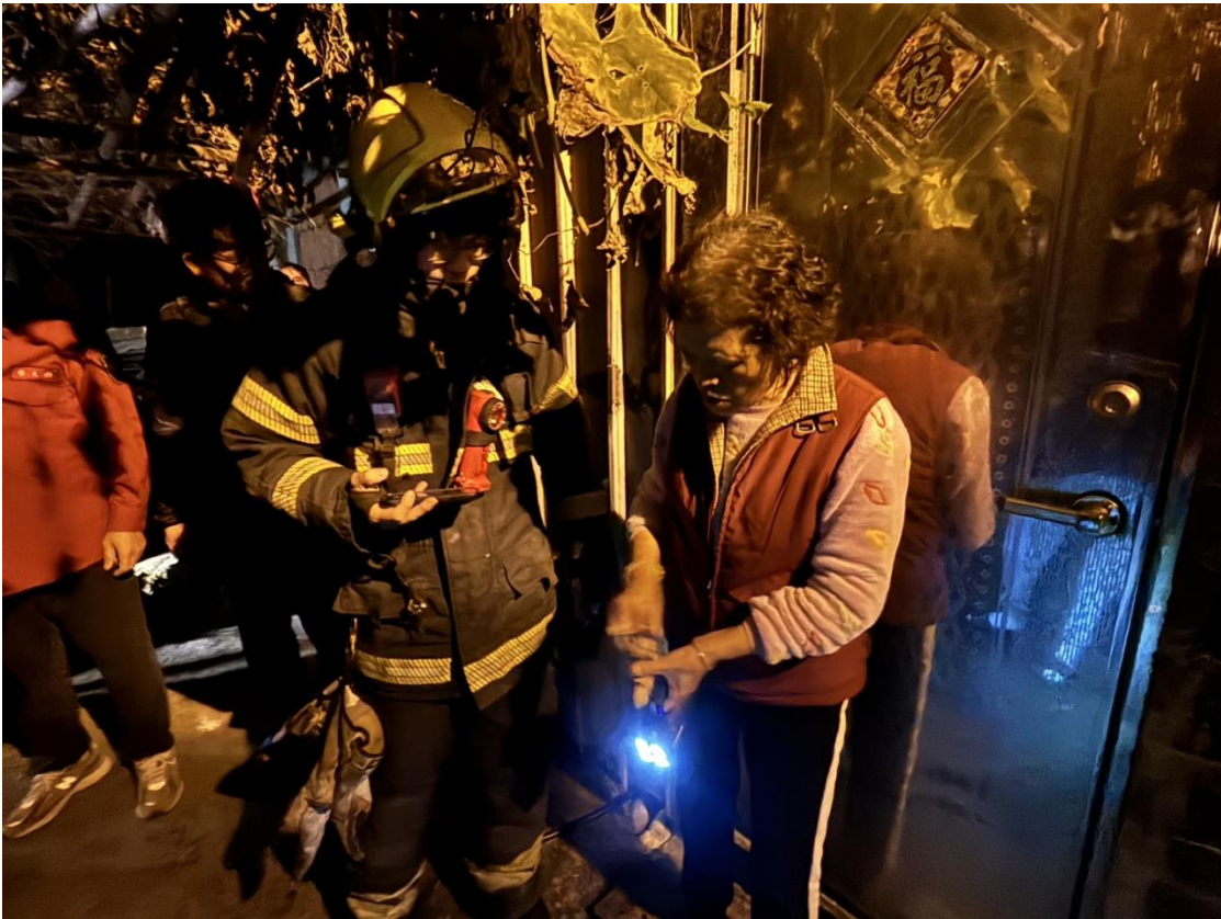
圖四：附近災後訪視情形