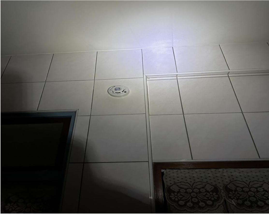
圖二：住警器安裝位置