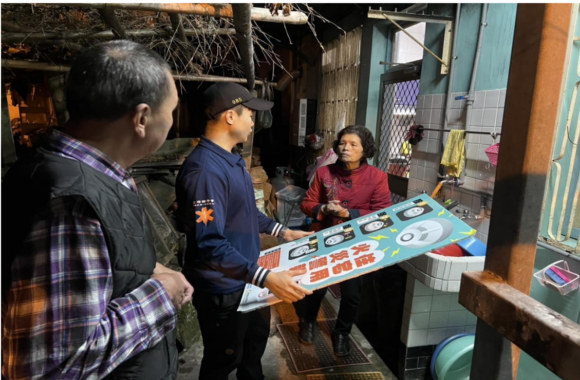
圖五：附近災後訪視情形