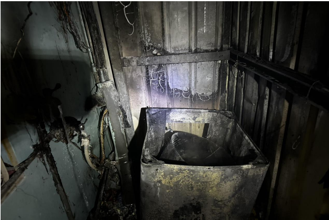
圖一：火災現場情形