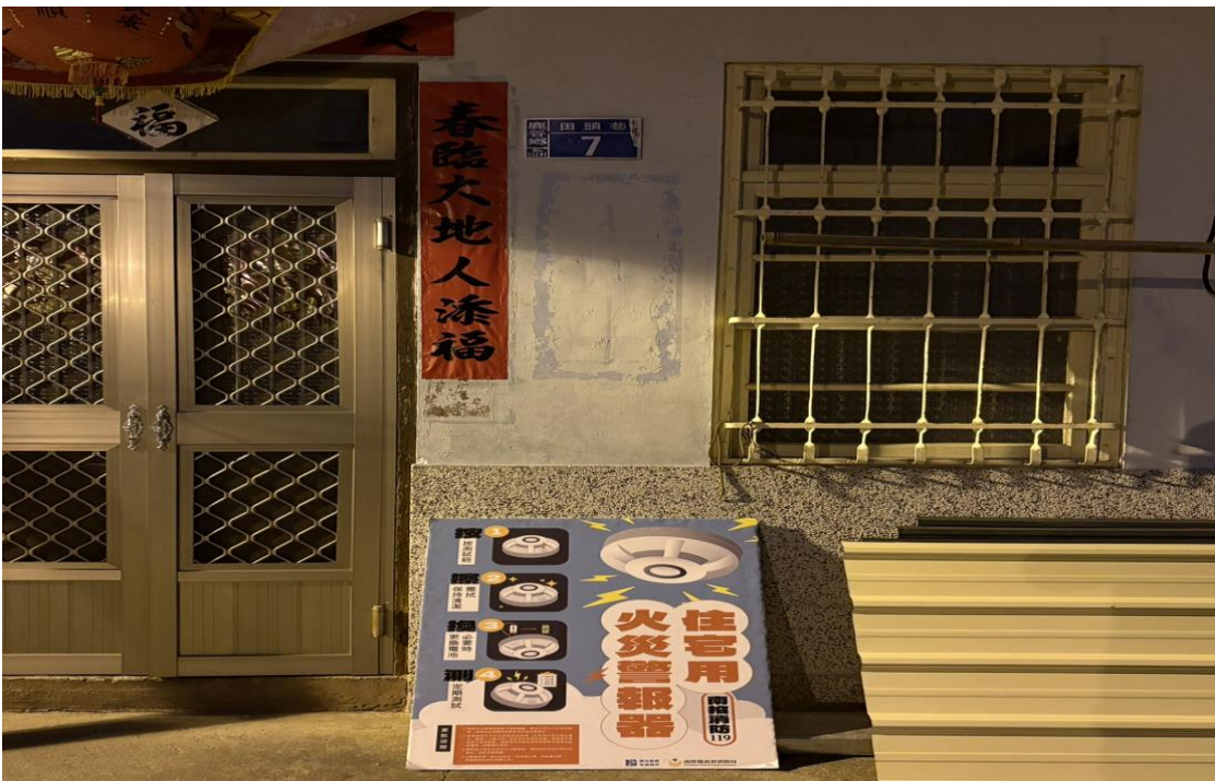
圖三：附近災後訪視情形