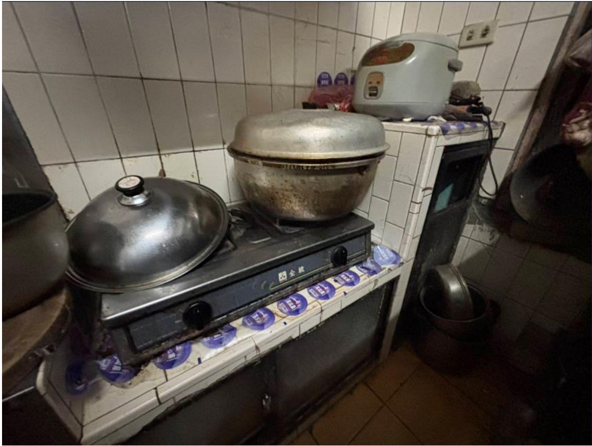
圖三：住警器裝設位置(廚房牆壁)